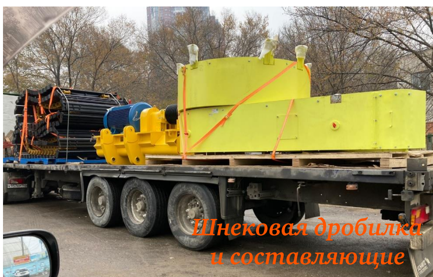
Шнековая дробилка и составляющие